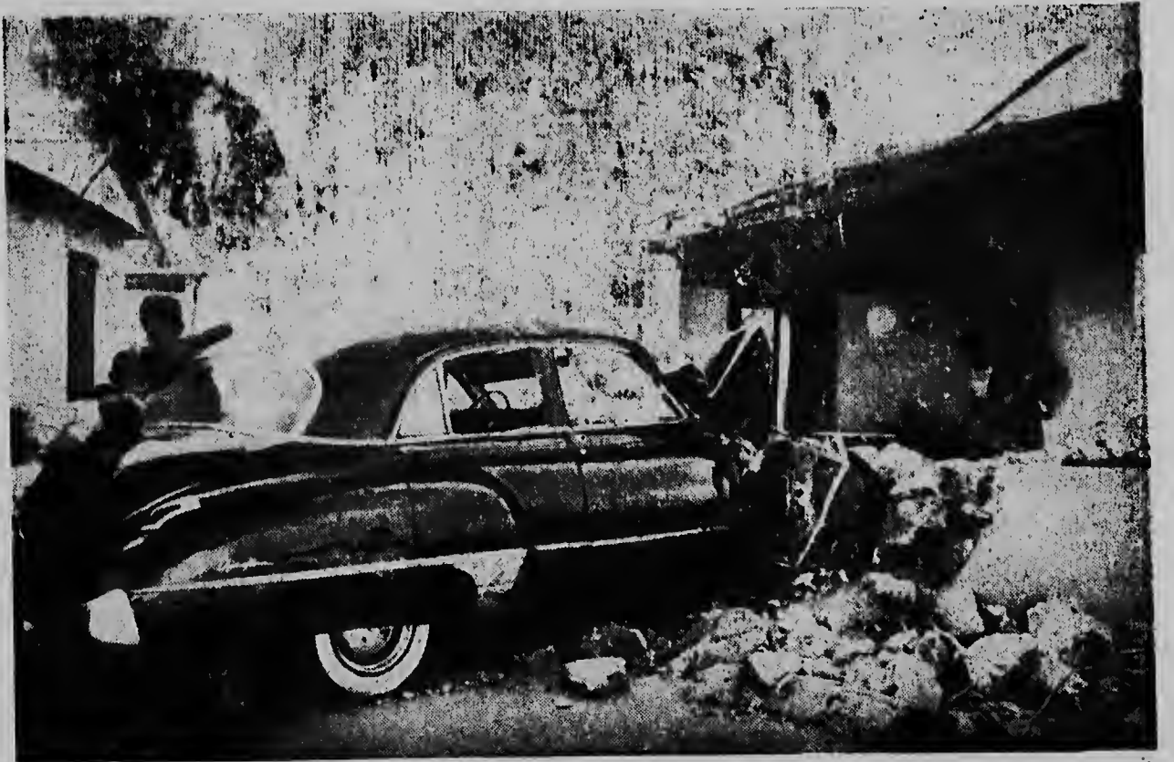
De buick in de eetkamer van het huis te Savaneta.

's GRAVENHAGE. — De Nederlandse pers noemde dezer dagen een voor prins Bernhard beledigend artikel in een Duits weekblad. Nadat het was bemerkt, werd de verkoop in Nederland stopgezet. Thans heeft, naar het A.N.P. van het departement van buitenlandse zaken verneemt, de Nederlandse regering haar demarche gedaan bij de Duitse regering, waarbij is verzocht te willen nagaan, of het mogelijk is verdere publicaties te voorkomen en of tegen het betreffende blad maatregelen kunnen worden genomen.